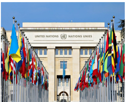
از روزنامه انيس

او تاکید کرده که شرکای بشردوست سازمان ملل متحد برای تدارک کمک ها به افغانستان رقابت می کنند و تنها در ماه دسمبر به ۷ میلیون نفر کمک مواد غذایی توزیع کرده اند. به گفته سخنگوی دبیرکل سازمان ملل متحد، کمک نقدی، خوراکی و غیر خوراکی در نقاط مختلف افغانستان در حال انجام است. دوجاريک گفت که تمویل کنندگان ۱.۵ ميليارد دالر برای کمک بشردوستانه در سال ۲۰۲۱ به افغانستان فراهم کرده اند. #