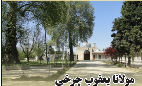
مولانا یعقوب چرخي

یعقوب بن عثمان بن محمود بن محمد غزنوي چرخي از مردم خراسان و از عارفان سده های ۸ و ۹ هجری است. مولانا یعقوب چرخي از اهالی ولسوالی چرخ ولایت لوگر بوده سال تولد وی معلوم نیست، اما بنا بر بررسی ها، سال تولد موصوف بین سال های ۵۷۵-۷۶۲ قمری می باشد.